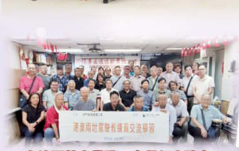
與澳門教車業職工會舉行座談會