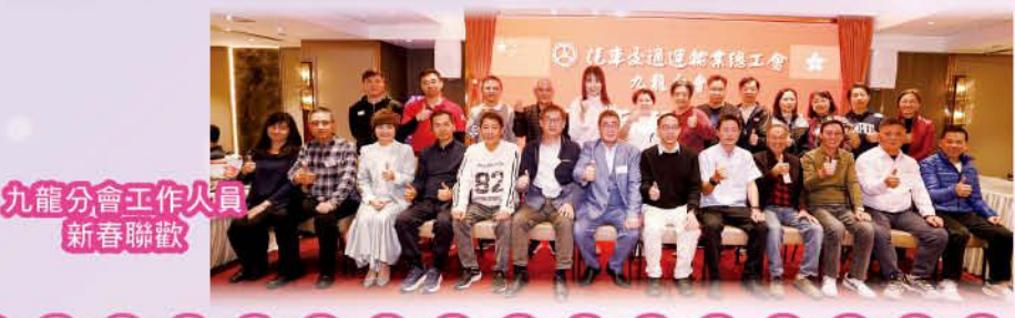
九龍分會工作人員 新春聯歡