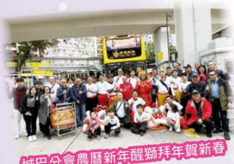
城巴分會農曆新年醒獅拜年賀新春