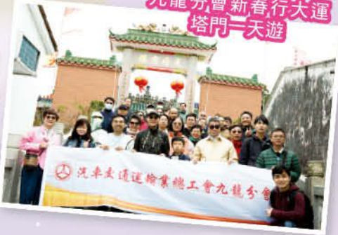
九龍分會新春行大運 塔門一天遊