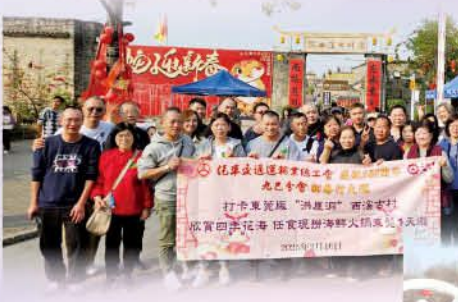
九龍巴士分會新春 行大運東莞二天遊