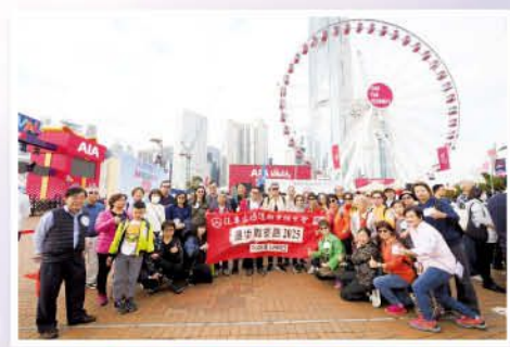
「漫步職安路」慈善步行籌款活動