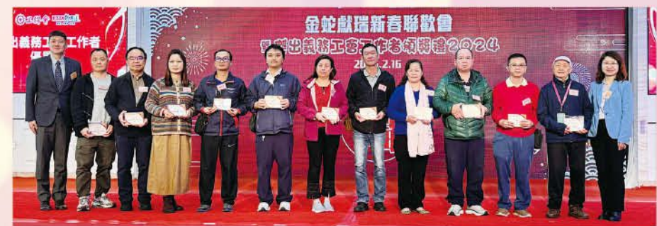
傑出義務工會工作者優異獎