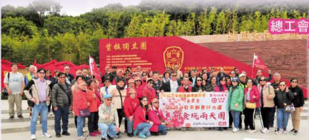
總工會港島區新春行大運 惠州二天遊