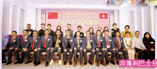
非專利巴士分會新春聯歡