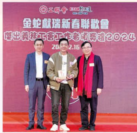
傑出義務工會工作者金獎