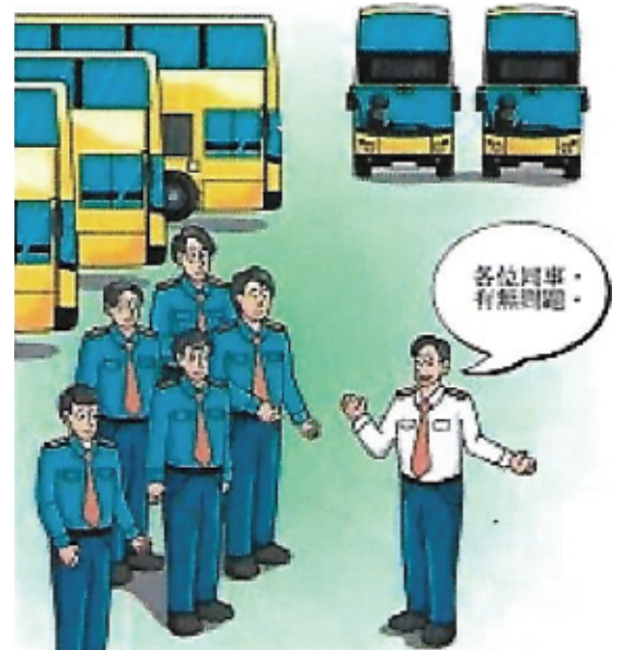
上司與同事之間多作溝通