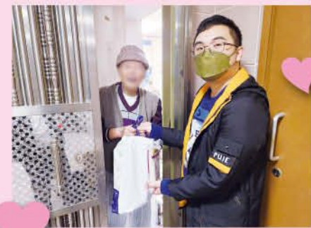
送防疫物資給年邁會員