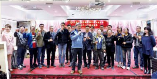
九龍分會各區工作 人員新春聯歡