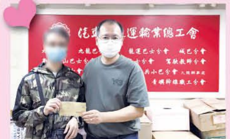
發放「工聯會職安健協會工傷經濟援助」支票