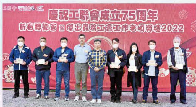
傑出義務工會工作者優異獎