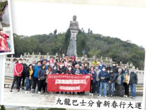
九龍巴士分會新春行大運