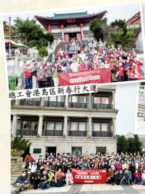
總會港島區新春行大運