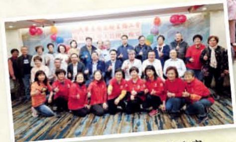
總會港島區工作人員團年晚宴